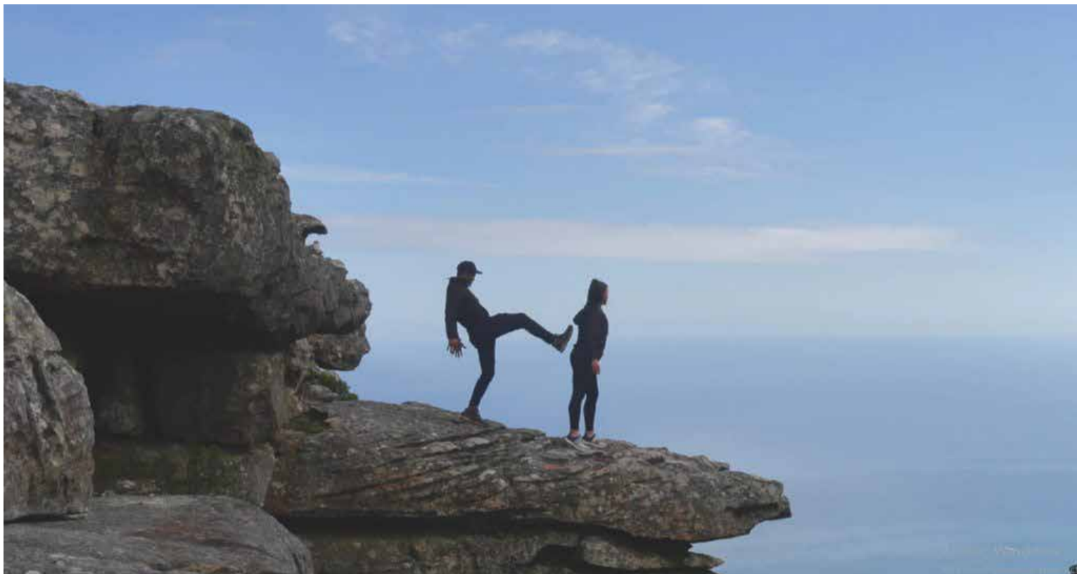
Los agresivos física y verbalmente, intentando provocar inseguridad en su víctima para hacerla débil, humillándola y faltando al respeto.

De vez en cuando hacen cosas por su víctima, pequeños favores que esconden un interés personal y que suelen cobrar en algún momento futuro («yo te hice este favor, ahora te toca a ti»). Son personas asfixiantes que presionan a su víctima para que haga cosas que no le apetece, sobrepasan continuamente sus límites para comprobar hasta dónde pueden llegar y esperan que esa persona esté siempre dispuesta a ayudarles en todo lo que necesiten.