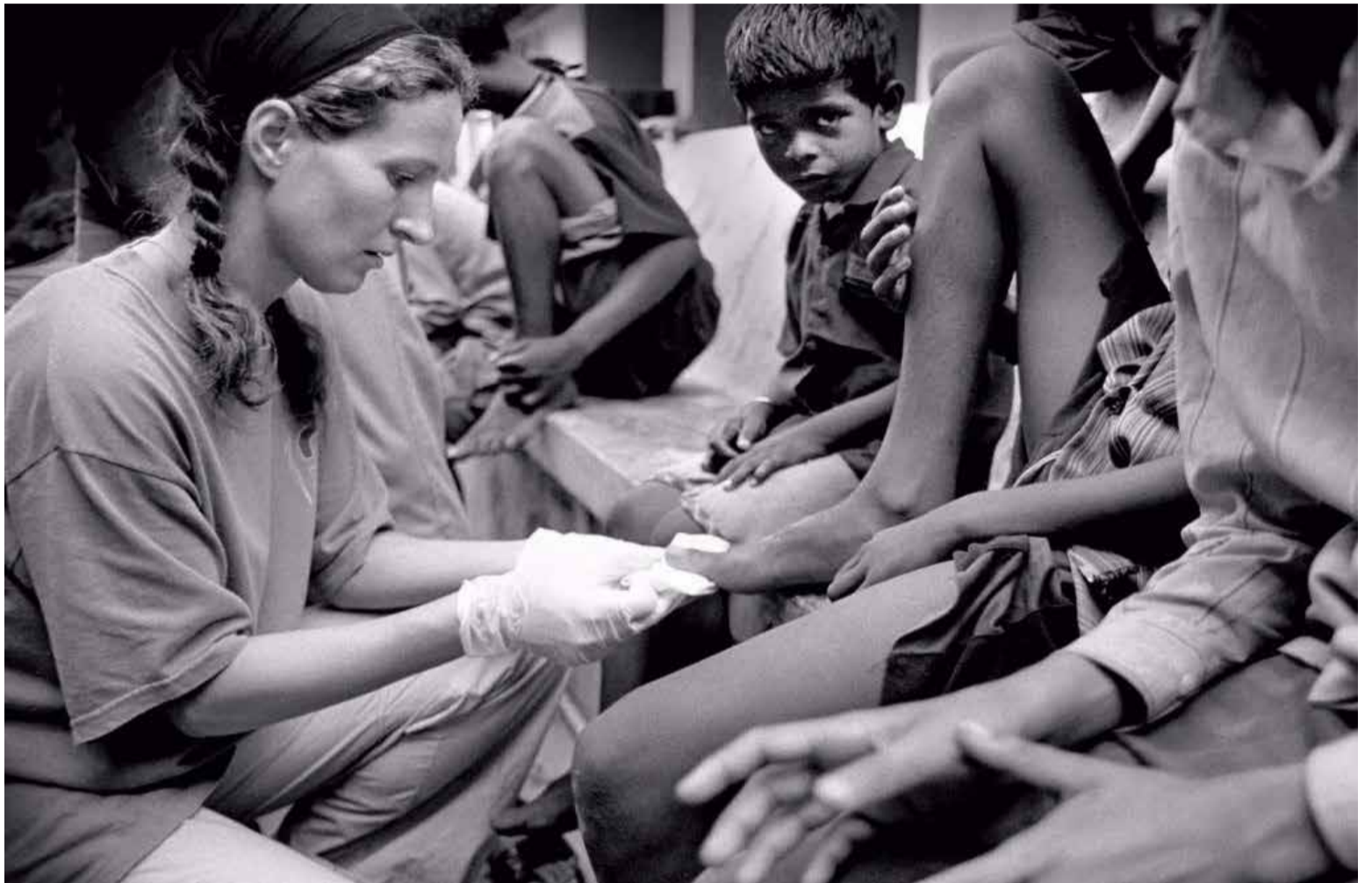
«Después del amor, la simpatía es la pasión divina del corazón humano», patentizó el escritor y orador irlandés Edmund Burke. Los filósofos de las escuelas antiguas y modernas califican la bondad como un don humano, tan necesario para la sociedad, como para conseguir la convivencia y la paz.

«También es la inversión que nunca falla», concibió el escritor norteamericano Henry David Thoreau, autor de la «Vida en los bosques». La bondad tiene innumerables facetas desde el simple gesto