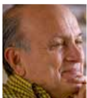
Gustavo Álvarez Gardeazábal

La denuncia del presidente Petro sobre el robo de armas y explosivos militares.