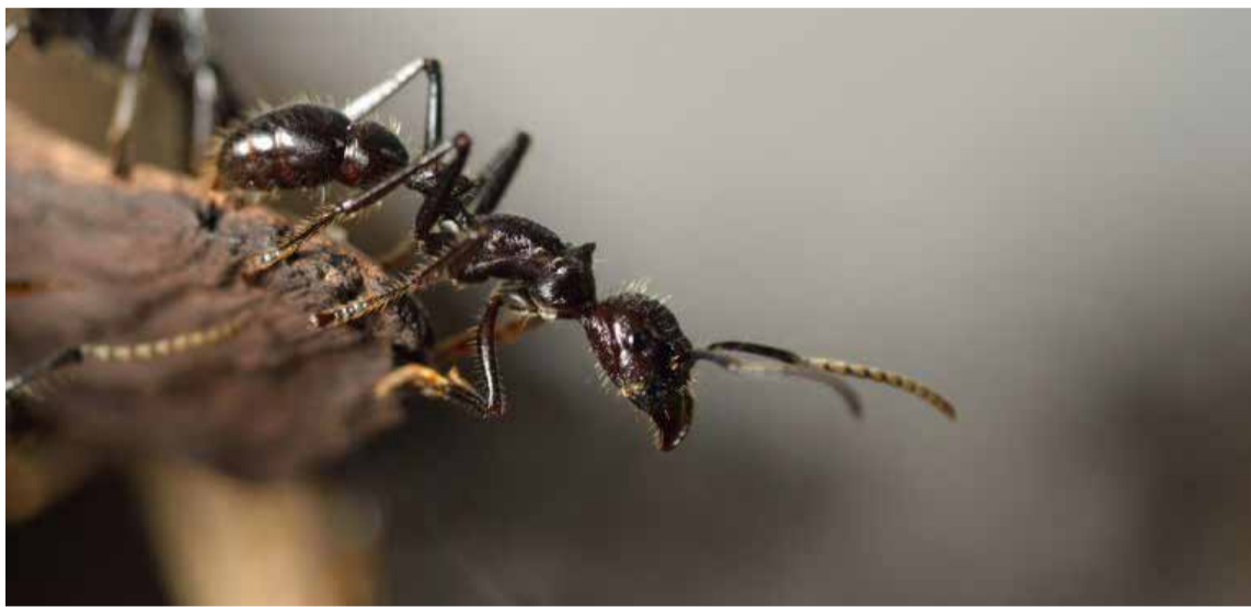
Las hormigas son uno de los grupos de insectos más comunes en los ecosistemas terrestres del planeta.

A l margen de la mala fama que tienen entre los agricultores hormigas como la arriera, más conocida por las hileras que forman cargadas de hojas de su mismo tamaño –o más grandes– que llevan a sus nidos, existen varias especies que cumplen un favor protector para diferentes cultivos, tales como palma, café, cítricos y pastos.