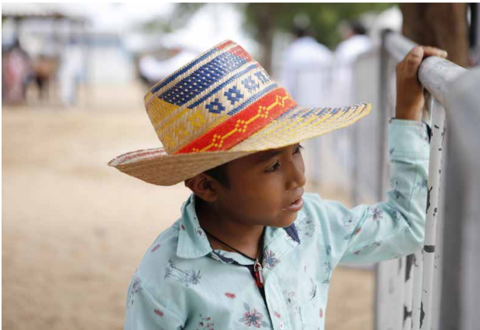
La mirada de esperanza de un niño en La Guajira

La estrategia es liderada por la Presidencia de la República y el Grupo Aval, en asocio con Promigas, La W y el Grupo Prisa.