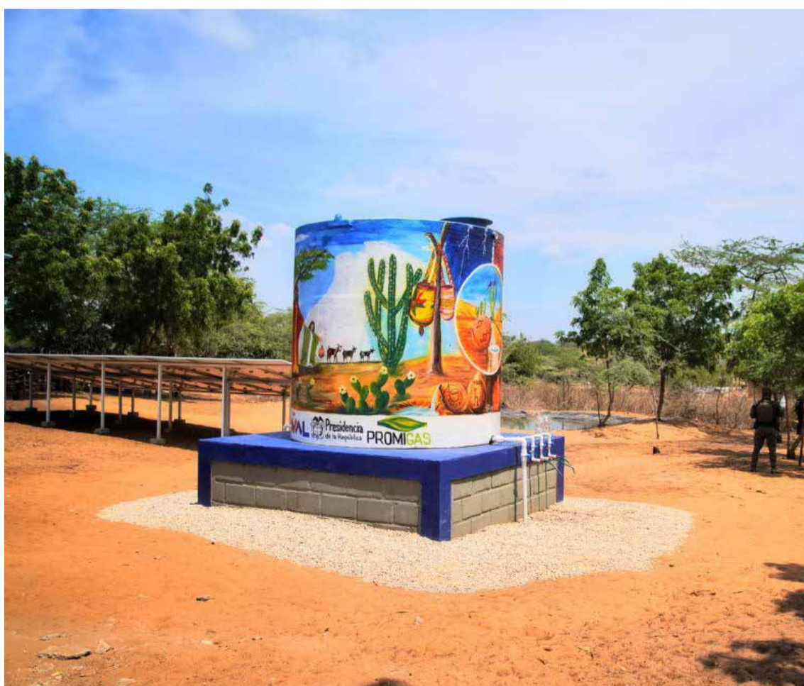
El tanque central de agua