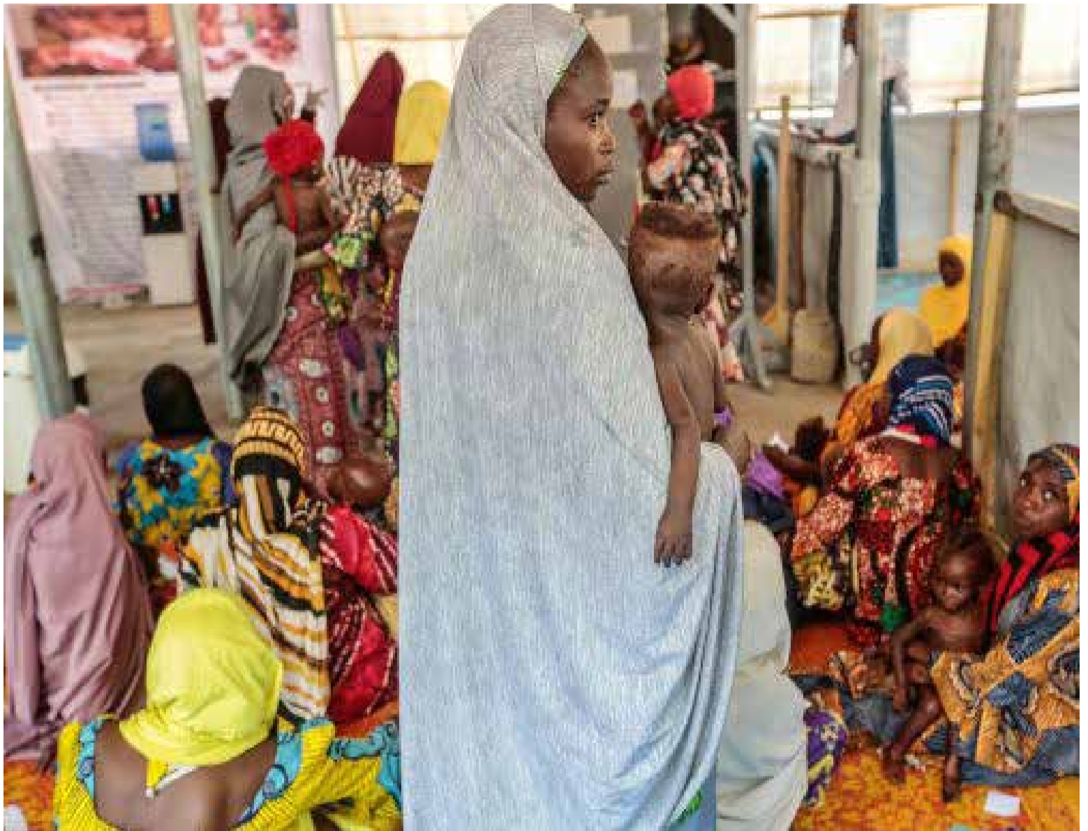
La situación de hambre es crítica en África.

El hambre es causa y consecuencia de guerras y conflictos armados. Entre los países con mayores tasas de desnutrición, abundan los que se encuentran en emergencia