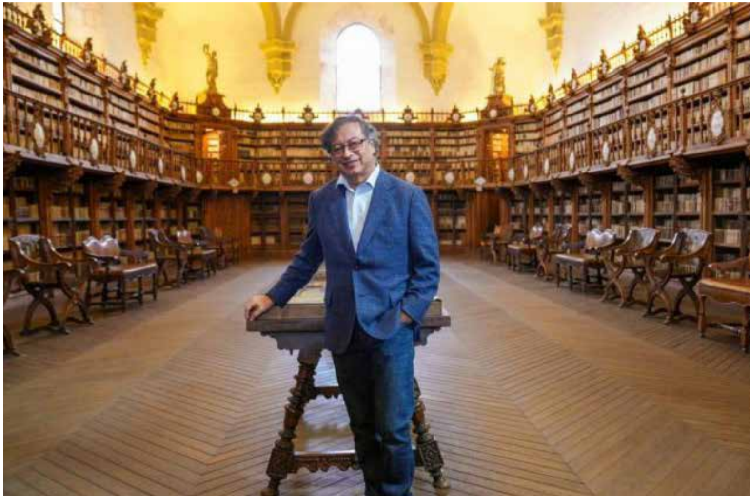
Gustavo Petro Urrego, presidente de Colombia.