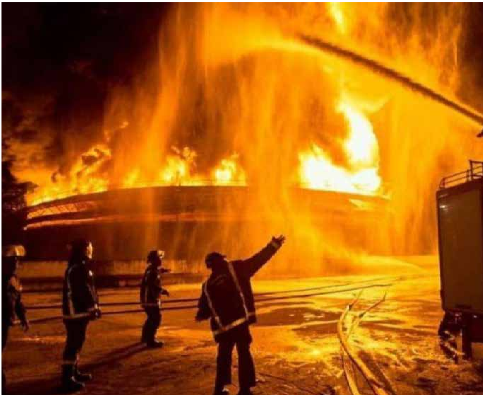
Bomberos en plena actividad