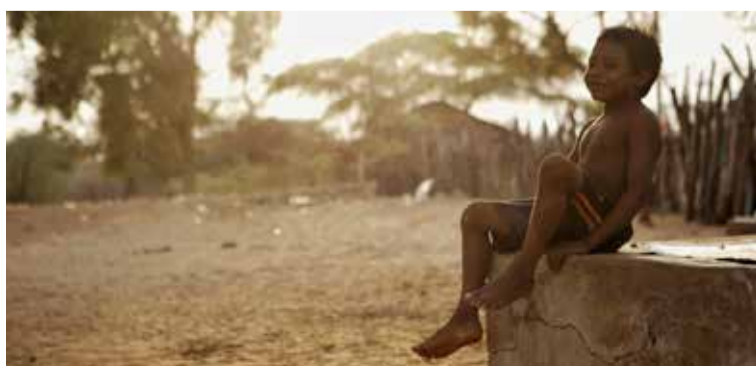
Felicidad de los niños por la llegada de agua.