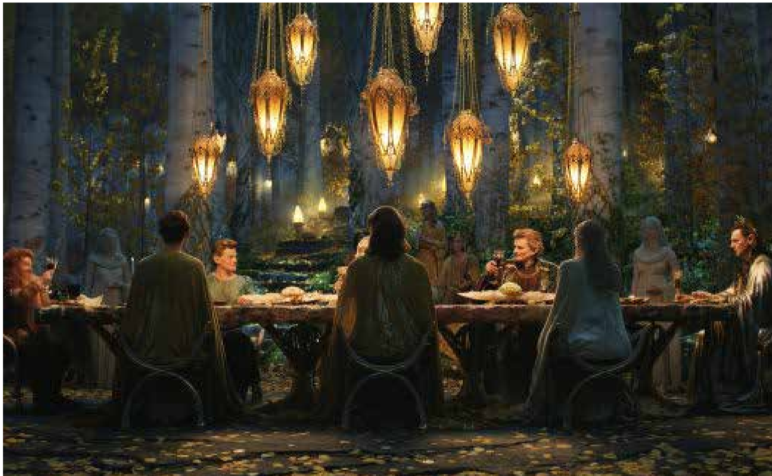
El Señor de los Anillos