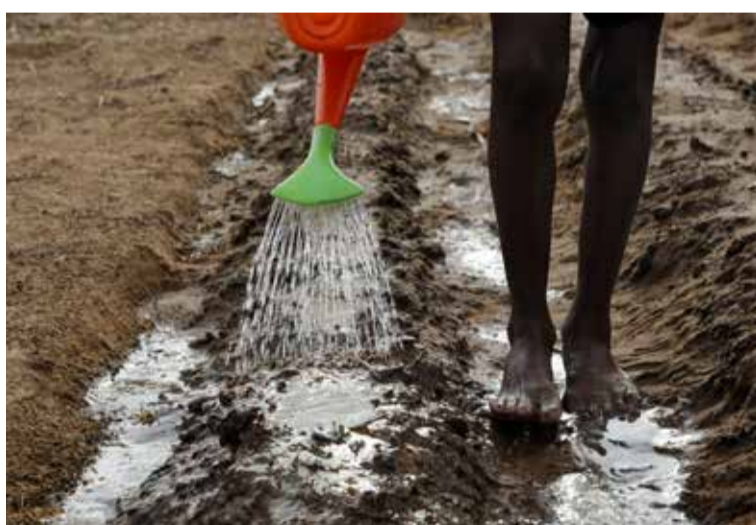
Por fin agua en las tierras de La Guajira