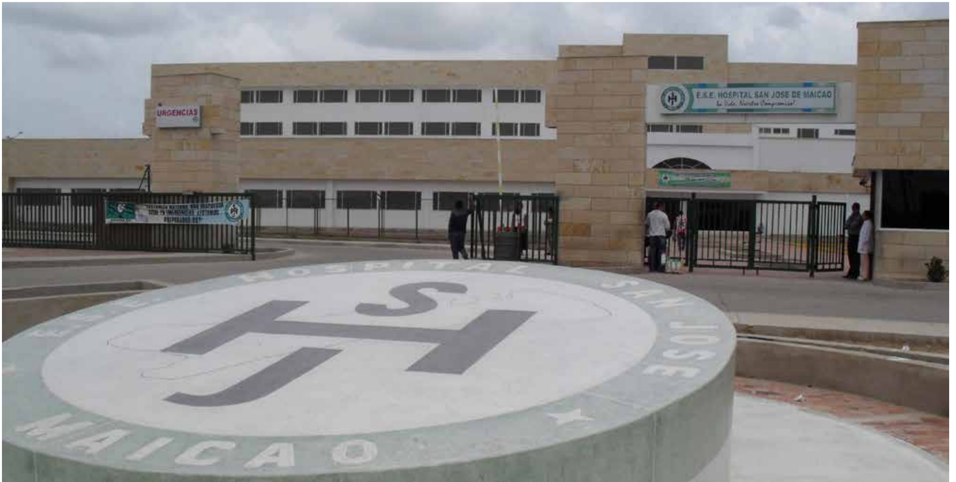
Hospital San José de Maicao

E l presidente Gustavo Petro destacó este sábado la historia que encierra el Hospital San José de Maicao, que fue el mejor hospital construido en el país hace 15 años, prestó múltiples servicios a la población y terminó en quiebra e intervenido por el Estado, pero que debe llegar a acreditarse y conseguir la excelencia.